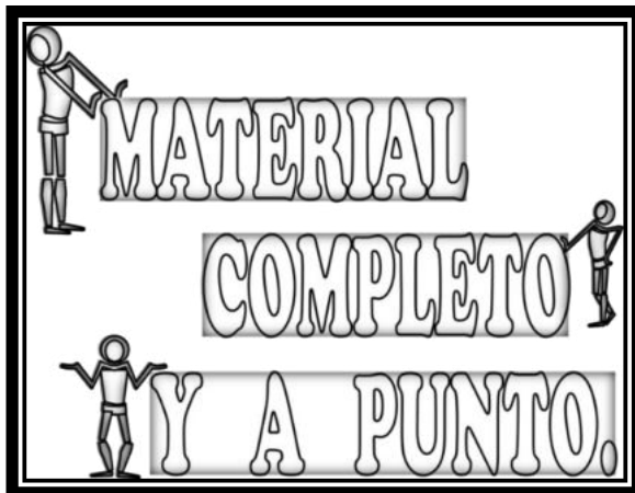
Imagen de creación propia

Y la tercera semana, siguiendo el ejemplo que hemos puesto, tendríamos: