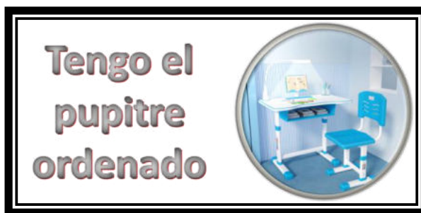
Imagen de creación propia